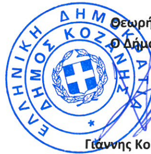
Φωτεινή Πατσιούρα ΠΕ Πληροφορικός