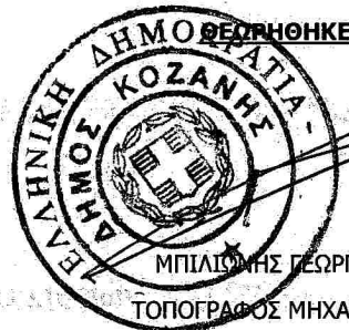
ΘΕΩΡΗΘΗΚΕ ΜΠΙΛΙΩΤΗΣ ΓΕΩΡΓΙΟΣ ΤΟΠΟΓΡΑΦΟΣ ΜΗΧΑΝΙΚΟΣ Δ/ΤΗΣ Δ.Τ.Υ. Δ.ΚΟΖΑΝΗΣ