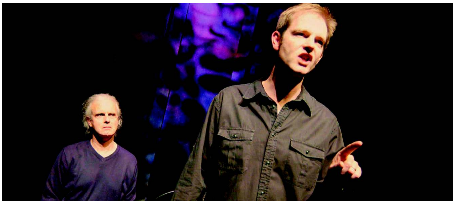
Οι κορυφαίοι αφηγητές Χιου Λάπτον και Ντάνιελ Μόρντεν παρουσίασαν τη βραβευμένη παράστασή τους στο 2ο Διεθνές Φεστιβάλ Αφήγησης & Τεχνών του Λόγου, στην Κοζάνη.