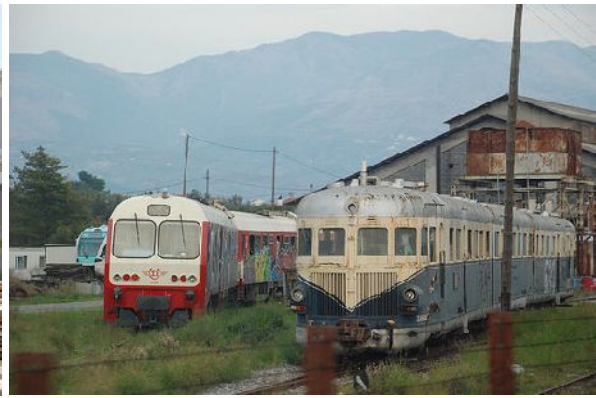
Βαγόνια - αυτοκινητάμαξες