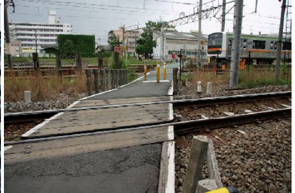
Ενδεικτικές λύσεις διέλευσης πεζών