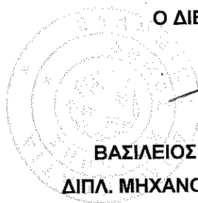
ΒΑΣΙΛΕΙΟΣ ΠΑΠΑΘΑΝΑΣΙΟΥ ΔΙΠΛ. ΜΗΧΑΝΟΛΟΓΟΣ ΜΗΧΑΝΙΚΟΣ