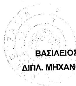
ΒΑΣΙΛΕΙΟΣ ΠΑΠΑΘΑΝΑΣΙΟΥ ΔΙΠΛ. ΜΗΧΑΝΟΛΟΓΟΣ ΜΗΧΑΝΙΚΟΣ