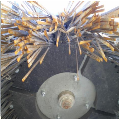
Φώτο 4 αναλώσιμου