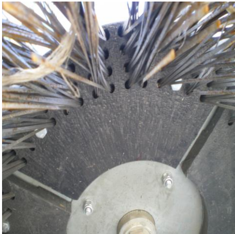
Φώτο 1 αναλώσιμου