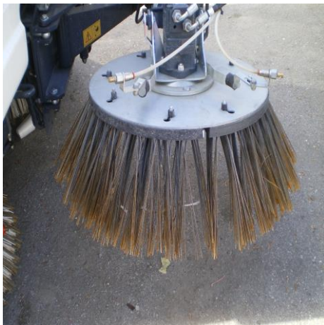
Φώτο 3 αναλώσιμου