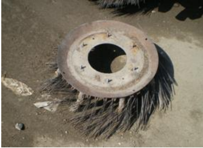
Φώτο αναλώσιμου RAVO