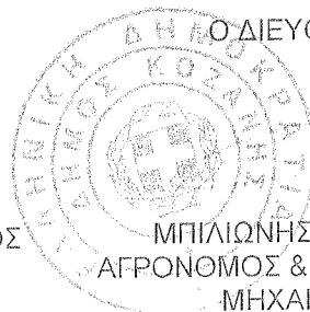
ΜΠΙΛΙΩΝΗΣ ΓΕΩΡΓΙΟΣ ΑΓΡΟΝΟΜΟΣ & ΤΟΠΟΓΡΑΦΟΣ ΜΗΧΑΝΙΚΟΣ