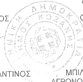
ΜΠΙΛΙΩΝΗΣ ΓΕΩΡΓΙΟΣ ΑΓΡΟΝΟΜΟΣ & ΤΟΠΟΓΡΑΦΟΣ ΜΗΧΑΝΙΚΟΣ