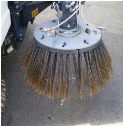
Φώτο 3 αναλώσιμου