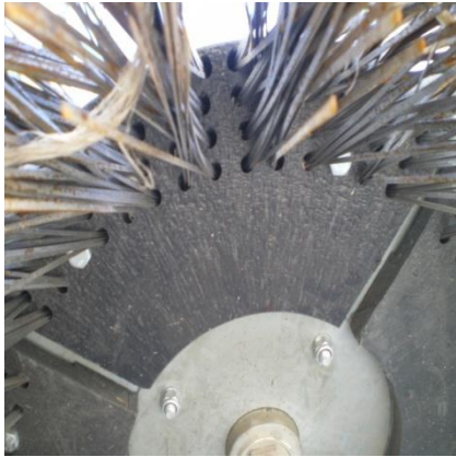
Φώτο 1 αναλώσιμου