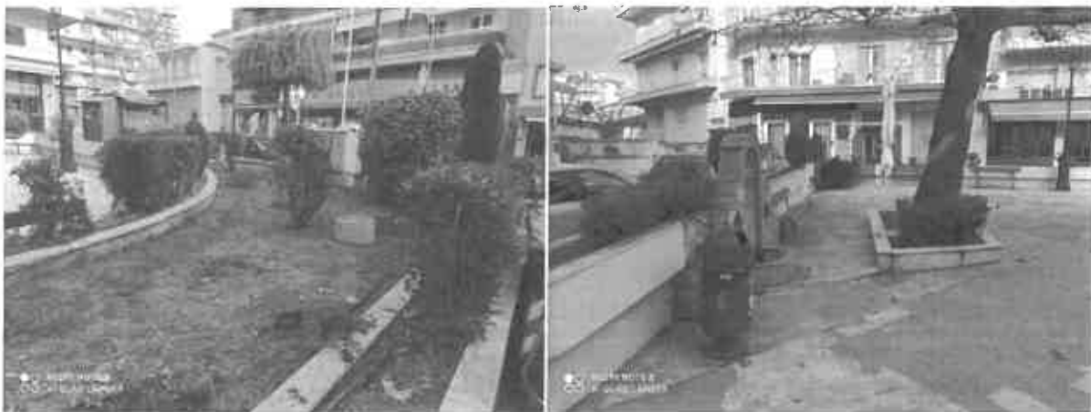
Φωτογραφία 2: Απόψεις της σημερινής πλατείας Γιολδάση