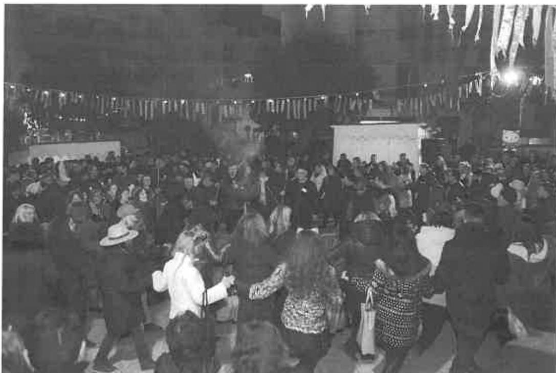
Φωτογραφία 1: Πλατεία Γιολδάση - Φανός Παύλου Μελά