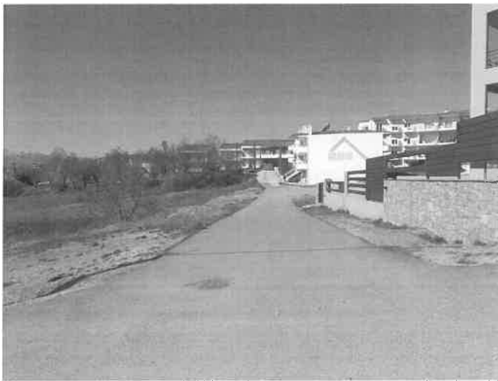
Φωτογραφία 2β: Άποψη των οδών περίξ του Ο.Τ.597 -οδός Αλφειού