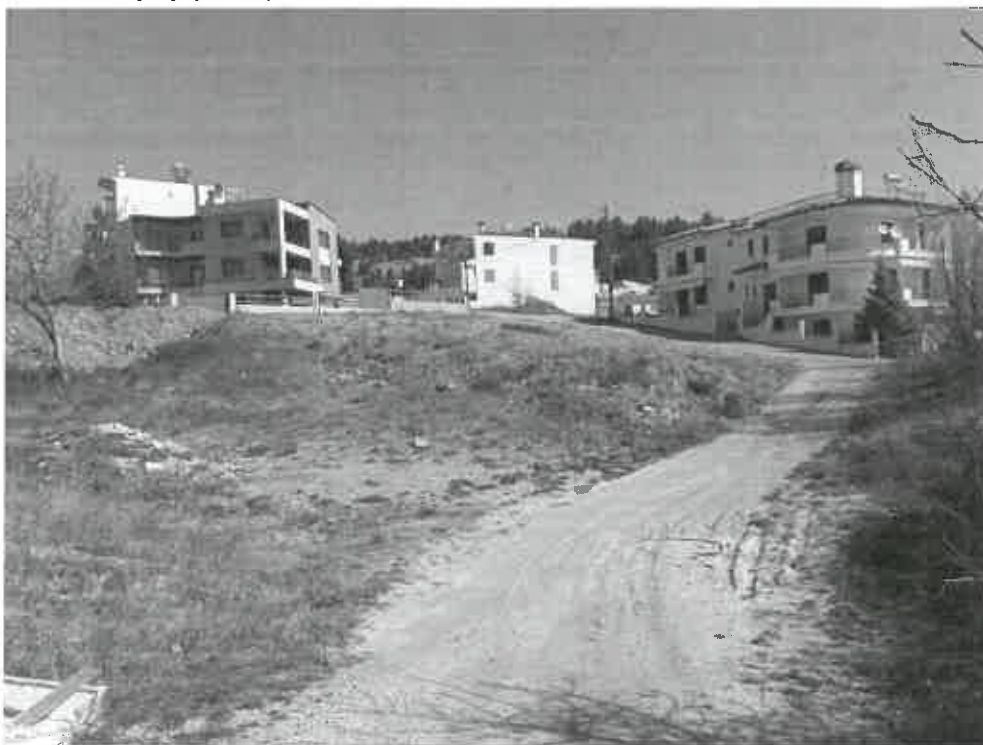
Φωτογραφία 1: Άποψη του χώρου του Ο.Τ. 597

Στο χώρο που πρόκειται να καταλάβει η πλατεία δεν έχει γίνει καμία παρέμβαση μέχρι σήμερα και ο χώρος είναι αδιαμόρφωτος.