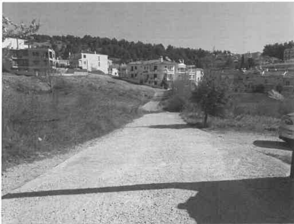
Φωτογραφία 2α: Άποψη των οδών περίξ του Ο.Τ.597- οδός Σπερχειού