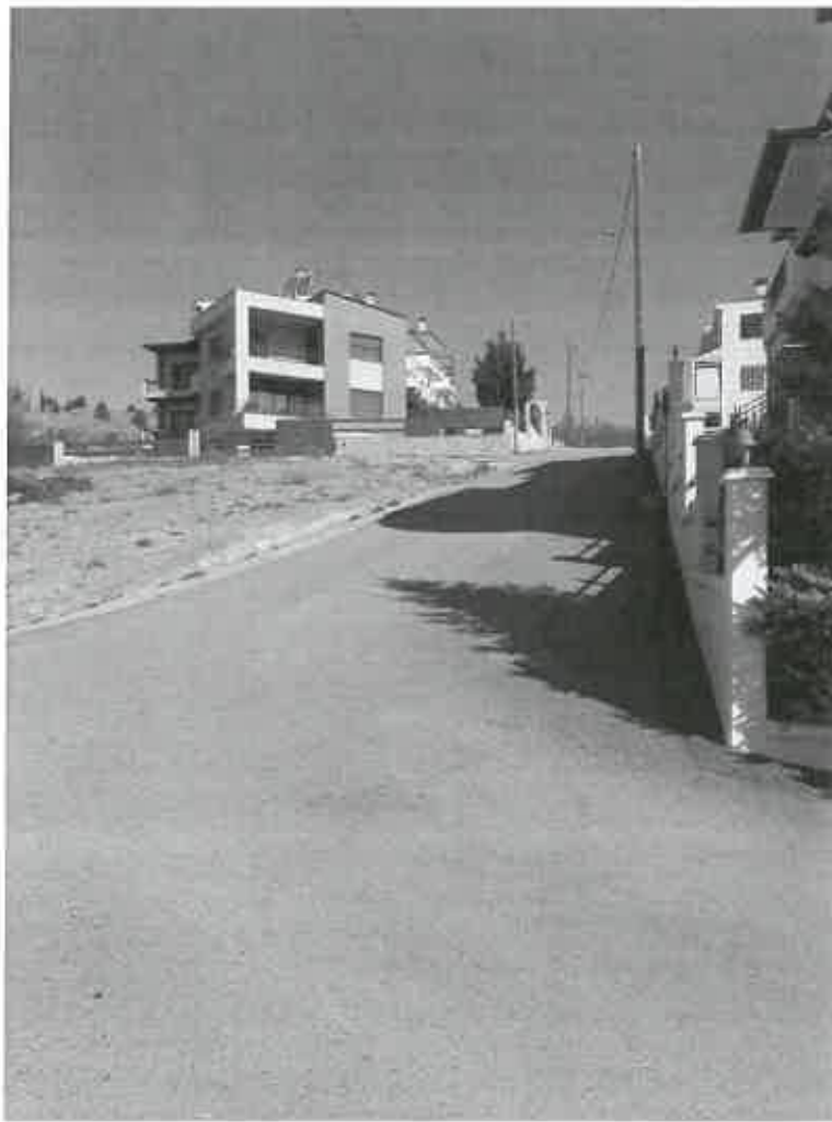
Φωτογραφία 2γ: Άποψη των οδών περίξ του Ο.Τ.597- οδός Αχελώου