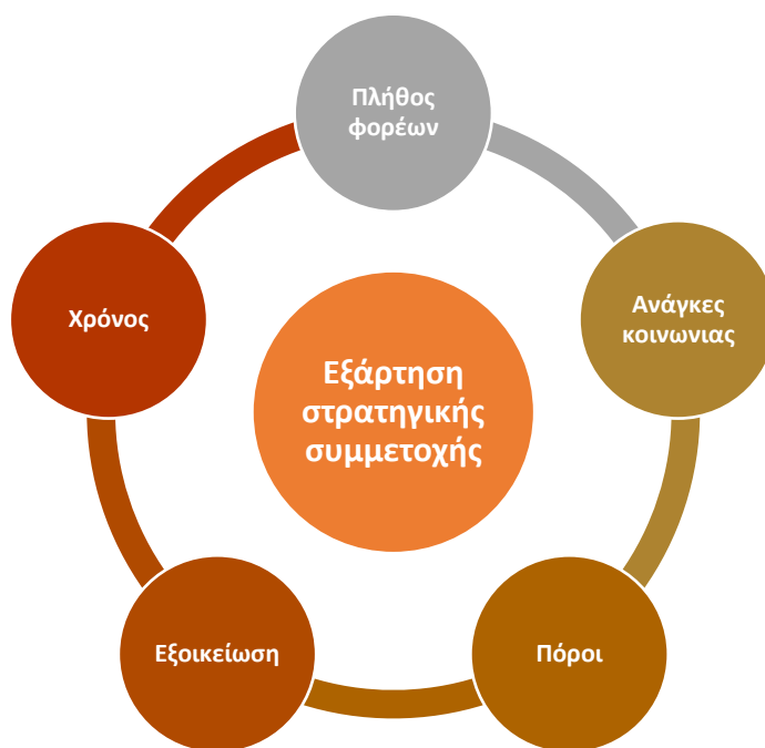
Εικόνα 2-2: Κρίσιμες παράμετροι καθορισμού στρατηγικής συμμετοχής

Λαμβάνοντας υπόψη τη μεταβλητότητα των αναγκών σε μια στρατηγική συμμετοχικού σχεδιασμού, η υιοθέτηση μιας στρατηγικής από κάποιο άλλο ΣΒΑΚ, ως καλή πρακτική, κρίνεται ως μη σκόπιμη. Αντιθέτως, εφαρμόζοντας τις μεθόδους του συμμετοχικού σχεδιασμού, η στρατηγική θα πρέπει να προκύψει ως αποτέλεσμα μελέτης της ομάδας έργου του ΣΒΑΚ, που θα προσαρμόζεται στις ανάγκες και τα χαρακτηριστικά του Δήμου.