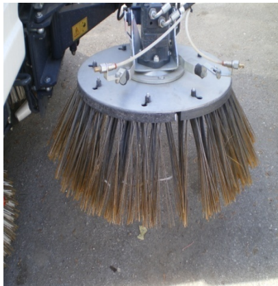
Φώτο 3 αναλώσιμου