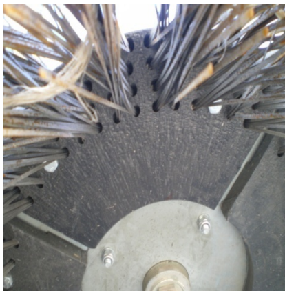
Φώτο 1 αναλώσιμου