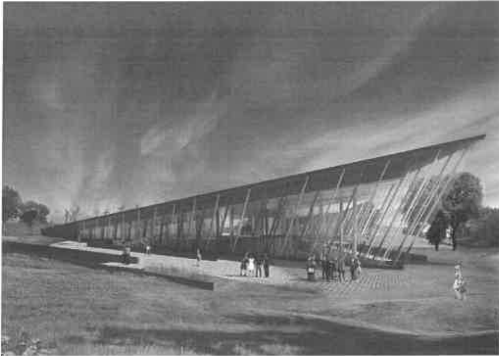
Εικόνα 1: Άποψη της προτεινόμενης αρχιτεκτονικής διαμόρφωσης του ΚΔΤ

Το κέντρο θα αναπτύσσεται σε τρία επίπεδα. Ενδιάμεσα από την είσοδο του ΚΔΤ και τους εκθεσιακούς χώρους θα μεσολαβεί χώρος υποδοχής του κοινού, στον οποίο θα στεγάζονται οι κοινόχρηστες χρήσεις (γκισέ πληροφοριών, σημείο έκδοσης εισιτηρίων, χώρος φύλαξης αντικειμένων, κεντρικό καθιστικό, πωλητήριο) καθώς και ένα πρώτο τμήμα της έκθεσης.