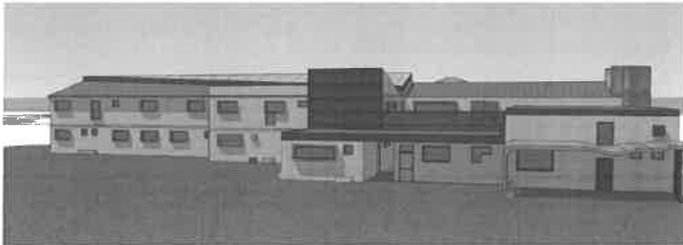
Εικόνα 2: Άποψη της προτεινόμενης αρχιτεκτονικής διαμόρφωσης του Ειδικού Δημοτικού / Νηπιαγωγείου

Το Ειδικό Νηπιαγωγείο / Δημοτικό προκειται να ανεγερθεί σε οικόπεδο όπου στεγάζεται ήδη το 18ο Δημοτικό Σχολείο. Το κτίριο του Ειδικού Νηπιαγωγείου / Δημοτικού θα είναι δώροφο με υπόγειο. Στο ισόγειο πρόκειται να στεγαστεί το Ειδικό Νηπιαγωγείο, στον όροφο το Ειδικό Δημοτικό Σχολείο ενώ στο υπόγειο θα στεγαστούν οι βοηθητικοί χώροι.