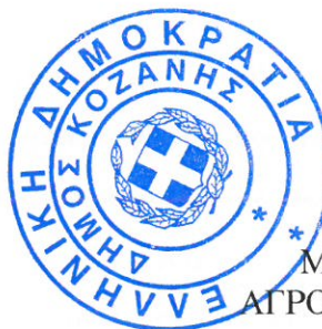
ΜΗΛΙΩΝΗΣ ΓΕΩΡΓΙΟΣ ΑΓΡΟΝΟΜΟΣ & ΤΟΠΟΓΡΑΦΟΣ ΜΗΧΑΝΙΚΟΣ