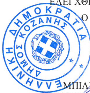
ΜΠΙΛΙΩΝΗΣ ΓΕΩΡΓΙΟΣ ΑΓΡΟΝΟΜΟΣ & ΤΟΠΟΓΡΑΦΟΣ ΜΗΧΑΝΙΚΟΣ