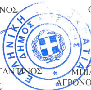
ΜΗΛΙΩΝΗΣ ΓΕΩΡΓΙΟΣ ΑΓΡΟΝΟΜΟΣ & ΤΟΠΟΓΡΑΦΟΣ ΜΗΧΑΝΙΚΟΣ