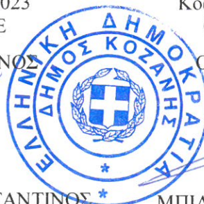
ΜΠΙΛΙΩΝΗΣ ΓΕΩΡΓΙΟΣ ΑΓΡΟΝΟΜΟΣ & ΤΟΠΟΓΡΑΦΟΣ ΜΗΧΑΝΙΚΟΣ