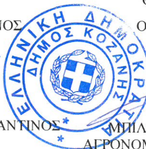
ΜΠΙΛΙΩΝΗΣ ΓΕΩΡΓΙΟΣ ΑΓΡΟΝΟΜΟΣ & ΤΟΠΟΓΡΑΦΟΣ ΜΗΧΑΝΙΚΟΣ