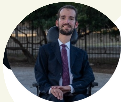
ΣΤΕΛΙΟΣ ΚΥΜΠΟΥΡΟΠΟΥΛΟΣ ΕΥΡΩΒΟΥΛΕΥΤΗΣ - ΕΑΚ | ΨΥΧΙΑΤΡΟΣ